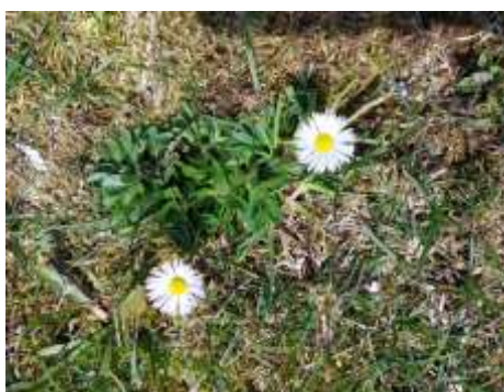
Lea Štimac, 5. r.

No tijekom školske godine bili su vrijedni i članovi naših Fotografa uz vodstvo učiteljice Anamarije Diklić :