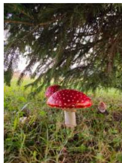
Matea Pleše, 5. r.